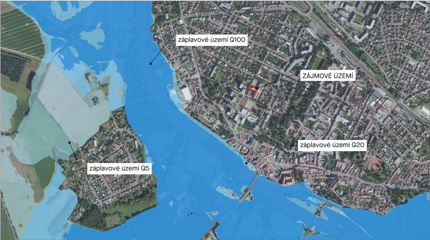
Řešené území ve vztahu k zájmům ochrany životního prostředí, záplavové území.