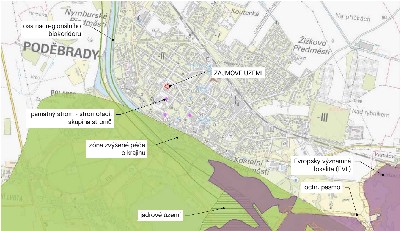
Řešené území ve vztahu k zájmům ochrany území.